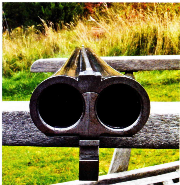
AYA's kortløbede Sherwood-geværer var for det meste monteret med den såkaldte Churchill-skinne. Altså en slank og meget høj sigteskinne, som ifølge E.J. Churchill skulle gøre skydningen med kortløbede geværer nemmere.