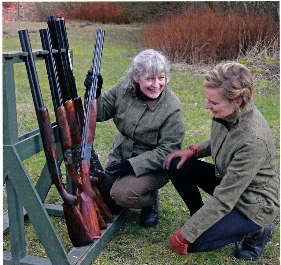
Det var selvfølgelig gevæernes skydeegenskaber og de specielle udformninger af skæftet, som havde førsteprioritet. Men også finish, udseende og håndtering blev der kigget grundigt på inden den praktiske skydning.

Nu bliver vi præsenteret for såkaldte ladyguns, damegeværer eller pigege-