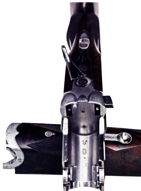
Låsens "tunge" del er i et stykke børstet stål. Sidepladerne med fjedrene er koblet på bagkanten af blokken. Her ses også tydeligt bundhængslingen uden tværbolt, men også befæstningerne i toppen til de to lukkeknaster og Greener-bolten i siden.