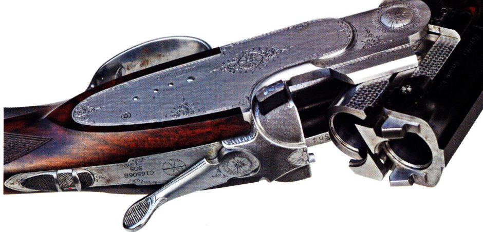
Det er tydeligt, at SO5-konstruktionen adskiller sig fra den mere almindelige Beretta-konstruktion. Bemærk de dobbelte lukkeknaster og den tværgående Greener-bolt. En af de mest sikre låsekonstruktioner i over/undere.

Det, der adskiller SO'erne fra mere moderne og mange andre over/undere i dag, er låsen, som er meget lav og så smal, som den nu kan blive i kaliber 12/70. Med dobbelthængsling i låseblokkens sider (altså uden tværgående hovedbolt), som vi ser på de fleste i dag, men yderligere med ►