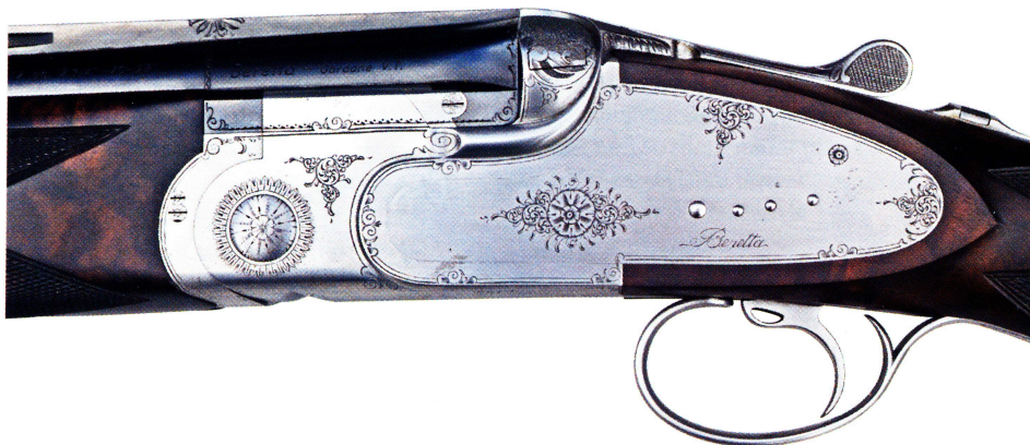
En ægte sidelås uden dikkedarer. Pladerne plejer ellers at være en ren legeplads for gravører. Men her har man holdt sig til det enkle. Og det er bevidst for at sikre den stilrene elegance.