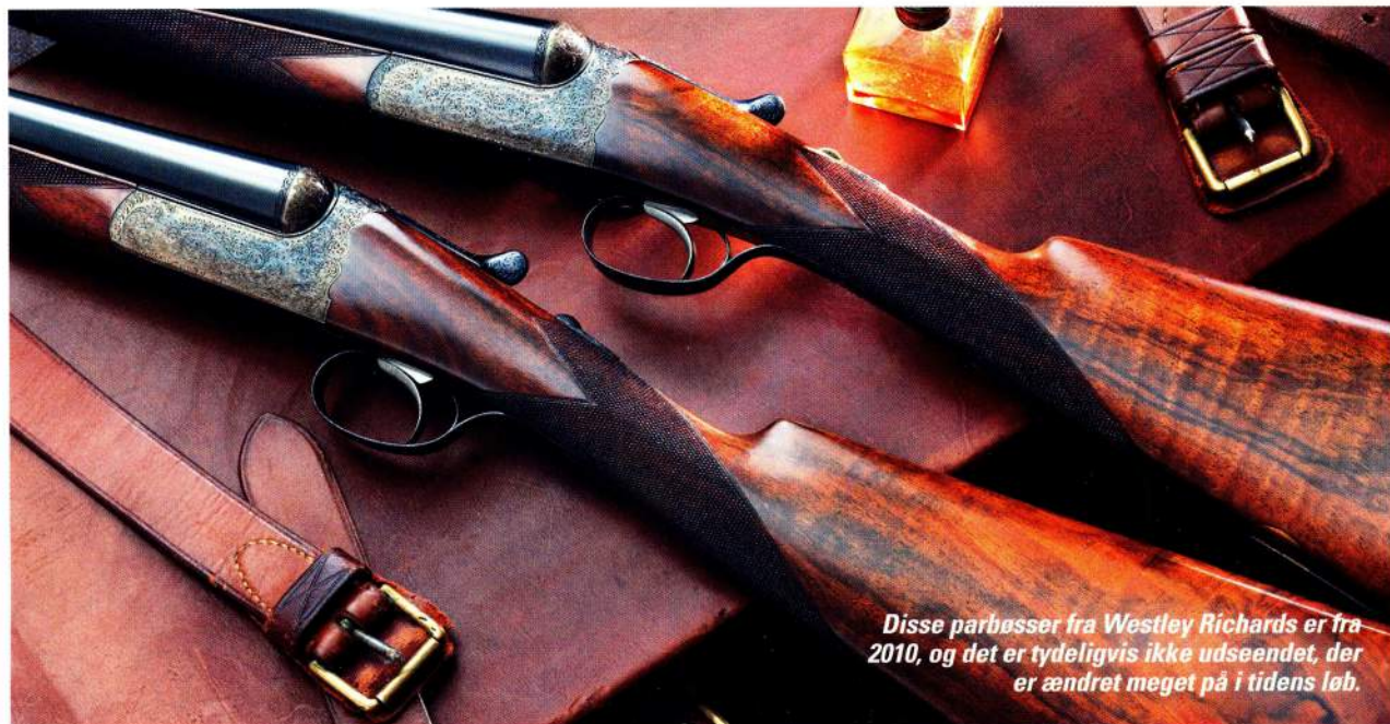
Disse parbøsser fra Westley Richards er fra 2010, og det er tydeligvis ikke udseendet, der er ændret meget på i tidens løb.

være rustet op i en engelsk lade, men der er en mulighed for at efterlyse makkeren hos "matchedpairs.com", som er en engelsk "datingside" på nettet, hvor ejere af det ene gevær af et sæt parbøsser efterlyser makkeren. Det lykkes jævnligt at få et gammelt sæt parret igen efter måske 100 års adskillelse.