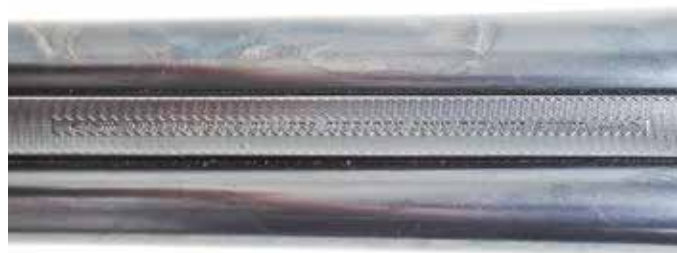
Parker Brothers startede i den lille by Meriden i Connecticut og endte sine dage ejet af Remington. Den sidste originale Parker blev lavet i 1947. Denne er fra 1905.