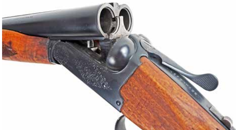
Brownings BSS fra Japan og Korea er jo ikke kendetegnet ved superfin finish og udseende. Men uden tvivl en slider, som har mange skud i sig endnu

Geværet er produceret fra 1971 til 1987, og det er helt specielt, at det er produceret i både Japan og Korea. Mange af delene er fra Japan, og så er det samlet i Korea. En meget spændende (læs: mystisk) produktion, og det er selvfølgelig Miruko, som står bag. Samarbejdet med Browning har jo en lang historie bag sig, og end ikke hos Browning i Liege kan man helt finde ud af, hvad der lå til grund for, at man i Japan pludselig skulle producere disse side-by-sides.