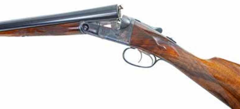
Ved første øjekast er det jo en helt almindelig side-by-side fra f.eks. Tyskland med nydeligt træ på det engelske skæfte. Flammebruneret baskyle og ikke megen udsmykning. Men det er en amerikaner.

En Parker som dette testgevær gør sig først og fremmest bemærket ved at